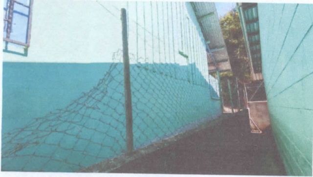
FOTO 1: REPARACION DE MURO PERIMETRAL CON BLOCK, MAYA Y TUBO DE LADO IZQUERDA