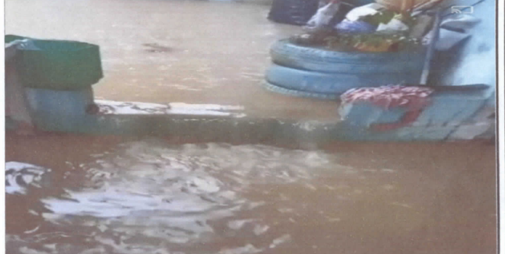
Foto 2: Levantado de piso de aula numero dos por inundación a causa de las fuertes lluvias por 31 años en servicio.