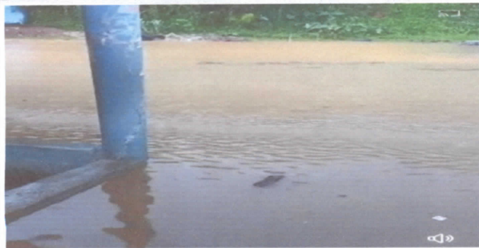
Foto 5: Levantado de piso por inundación a causa de las fuertes lluvias por 31 años en servicio.