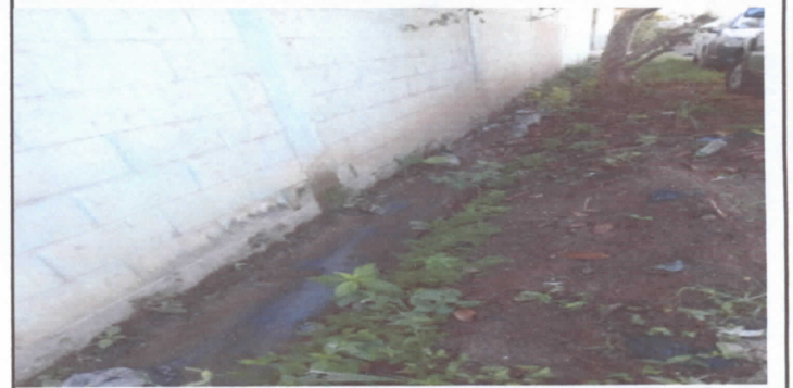
Foto 6: Reparacion de cuneta por inundación a causa de las fuertes lluvias por 31 años en servicio.

Observación: Si es necesario se pueden agregar hojas adicionales y actualizar el número de hojas.