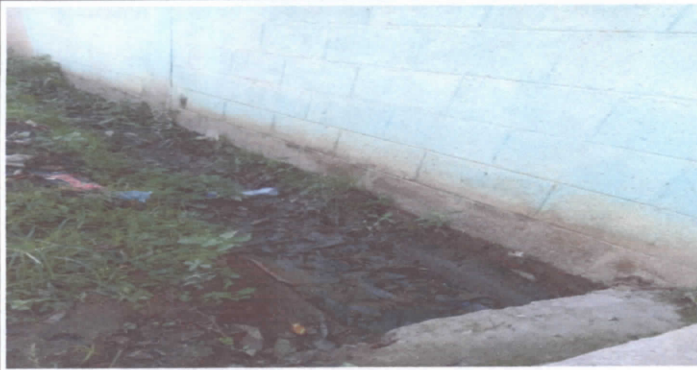
Foto 7: Reparación de cuneta por inundación a causa de las fuertes lluvias por 31 años de servicio