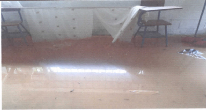
Foto 1: Levantado de piso de aula numero uno por inundación a causa de las fuertes lluvias por 31 años en servicio.