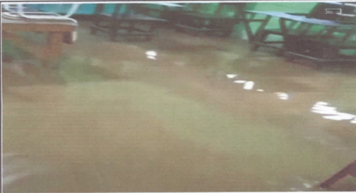
Foto 3: Levantado de piso de aula numero tres por inundación a causa de las fuertes lluvias por 31 años en servicio.