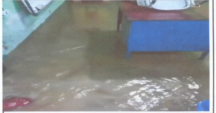
Foto 4: Levantado de piso de aula numero cinco por inundación a causa de las fuertes lluvias por 31 años en servicio.