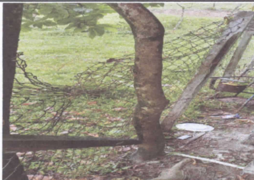
REPARACIÓN DE MURO PERIMETRAL CON UBICACIÓN AL ESTE