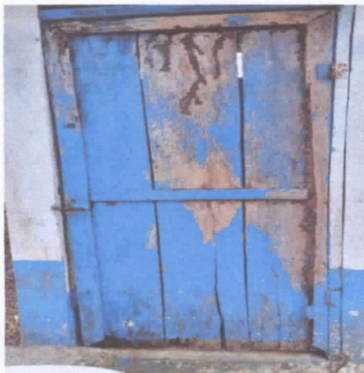
CAMBIO DE PUERTA DE MADERA POR PUERTA DE METAL