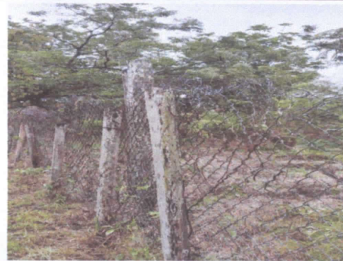
REPARACIÓN DE MURO PERIMETRAL CON UBICACIÓN AL NORTE