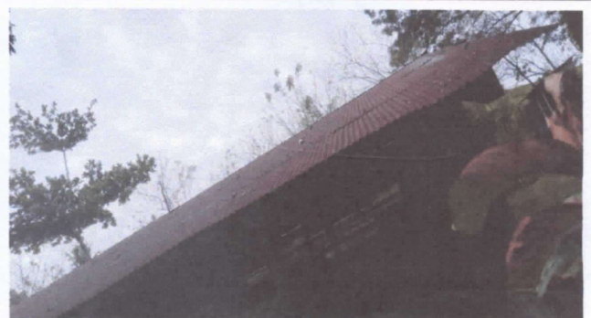
REPARACIÓN DE TECHADO

Observación: Si es necesario se pueden agregar hojas adicionales y actualizar el número de hojas.