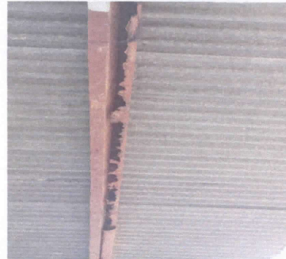
REPARACIÓN DE VIGA DE METAL