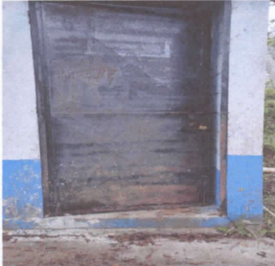
REPARACIÓN DE PUERTA DE METAL