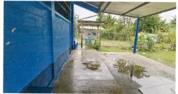
Foto 2: MODULO "C" SUMINISTRO E INSTALACION DE PISO CERAMICO. EN PASILLO