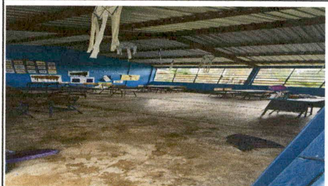
Foto 4: MODULO "B" SUMINISTRO E INSTALACION DE PISO CERAMICO EN AULA.