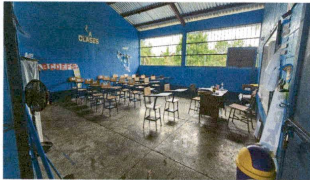
Foto 3: MODULO "B" SUMINISTRO E INSTALACION DE PISO CERAMICO EN AULA.