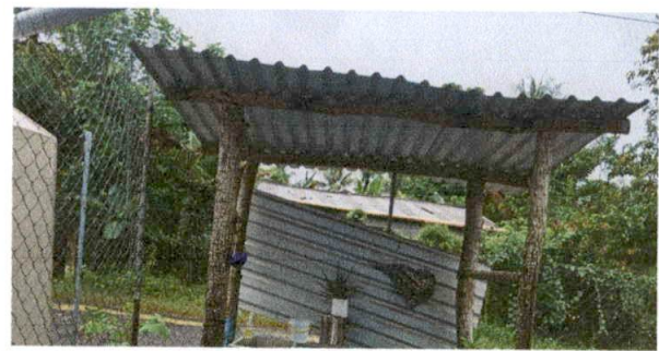
Foto 10: MODULO "D" SUMINISTRO E INSTALACION DE ESTRUCTURA METALICA.