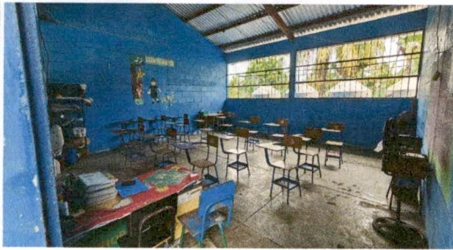
Foto 1: . MODULO "A" SUMINISTRO E INSTALACION DE PISO CERAMICO EN AULA.