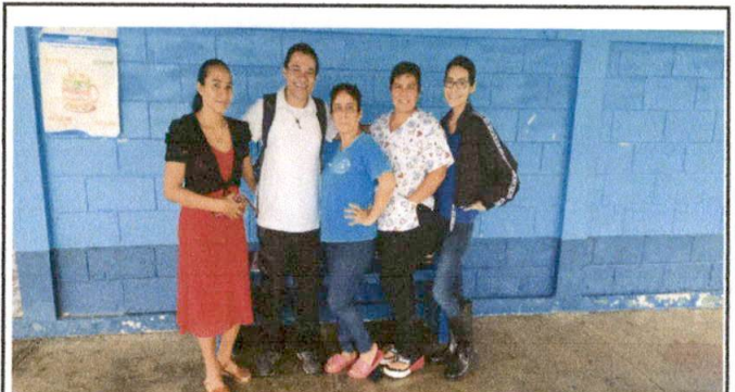
Foto 6: EVALUACION DE CAMPO CON AUTORIDADES DEL ESTABLECIMIENTO EDUCATIVO.