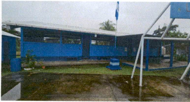
Foto 1: MODULO "C" SUMINISTRO E INSTALACION DE PISO CERAMICO. EN PASILLO.