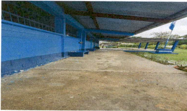
Foto 9: MODULO "C" SUMINISTRO E INSTALACION DE PISO CERAMICO. EN PASILLO.