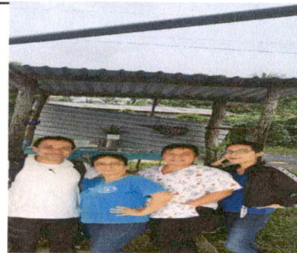
Foto 12: EVALUACION DE CAMPO CON AUTORIDADES DEL ESTABLECIMIENTO EDUCATIVO.