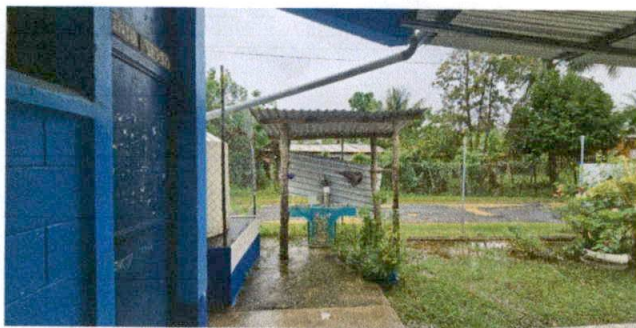
Foto 11: MODULO "D" SUMINISTRO E INSTALACION DE ESTRUCTURA METALICA.