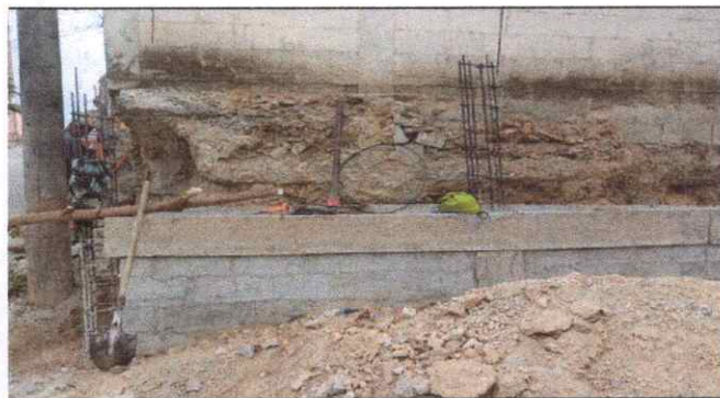
Foto 4: Muro en proceso de reparación, colocación de la segunda viga.