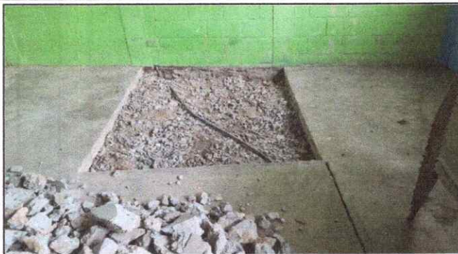
Foto1: Reparación de piso hundido aula No. 3