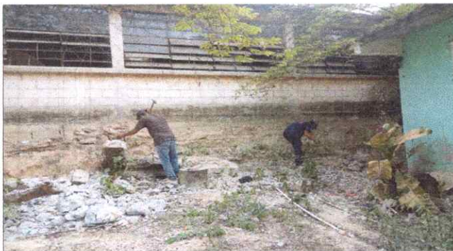
Foto 3: Limpieza de escombros del muro de contención que colapsó y preparación del área de trabajo.