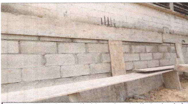
Foto 5: Avance en la Construcción del muro de contención, terminando de colocar block, colocación de última viga.