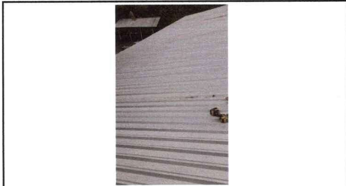
SUSTITUCION DE TECHO