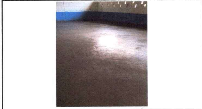
SUSTITUCION DE PISO