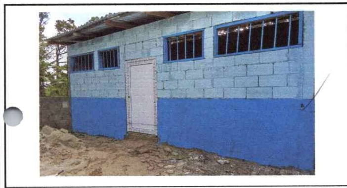
TERMINACION DE AULA