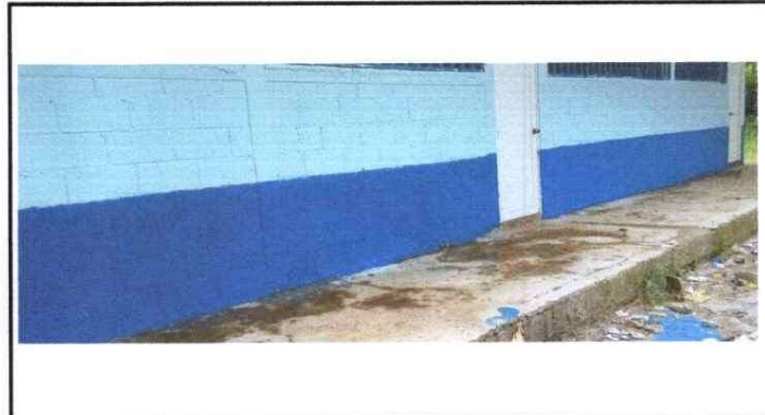
APLICACIÓN DE PINTURA EXTERIOR