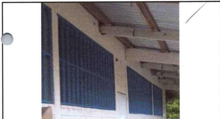
SUSTITUCION DE BALCONES