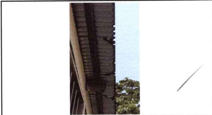
FOTO 1. REPARACIÓN TECHO LAMINADO