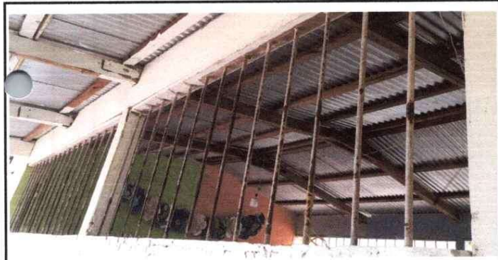
FOTO 3. BALCONES