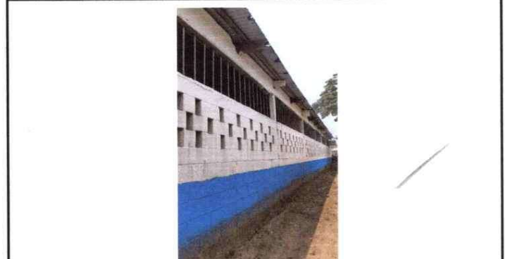
FOTO 4 PINTURA EXTERIOR