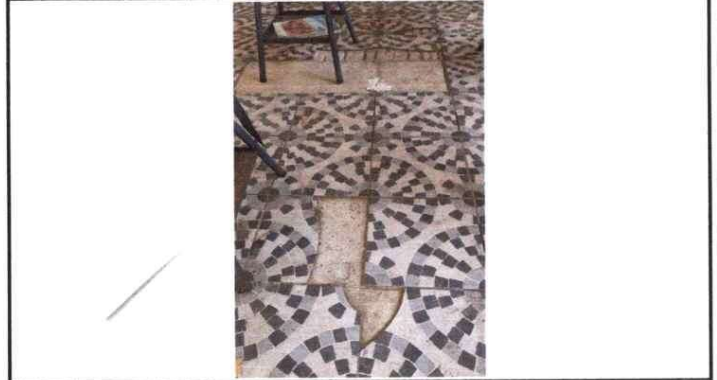
FOTO 2. REPARACIÓN DE PISO CERÁMICO