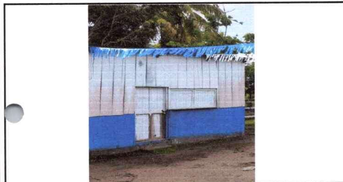
FOTO 5 Remozamiento aula