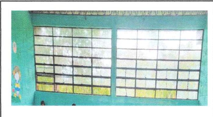
FOTO2: SUSTITUCIÓN DE BALCONES