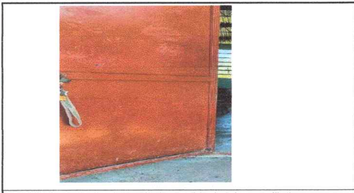
Mantenimiento a estructura (lijado, cambio de tubo , cepillado, sujeciones, aplicación de pintura)