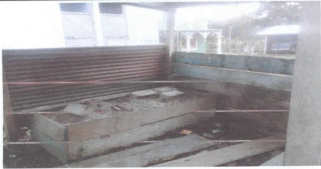
Sustitución torta de tierra por piso de cemento