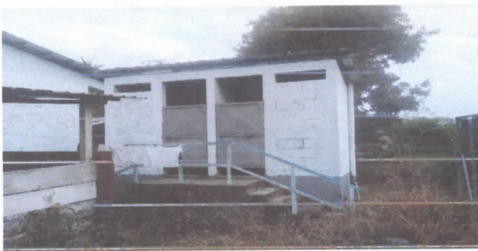
SERVICIO SANITARIOS Y SUS ACCESORIOS

Observación: Si es necesario se pueden agregar hojas adicionales y actualizar el número de hojas.