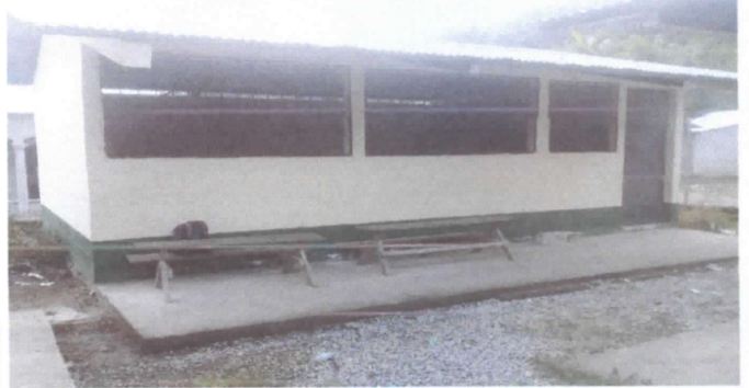
Pintura en muros exteriores e interiores