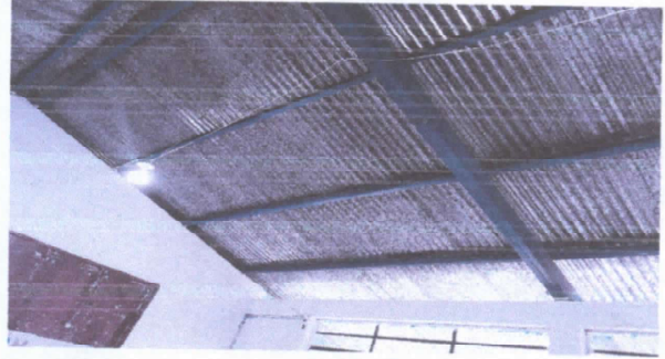
REPARACION DEL SISTEMA ELECTRRICO