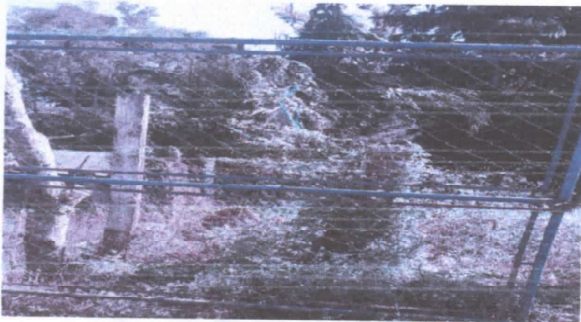
REPARACION DE PORTON