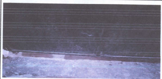
SUSTITUCION DE PUERTAS DE METAL

Observación: Si es necesario se pueden agregar hojas adicionales y actualizar el número de hojas.