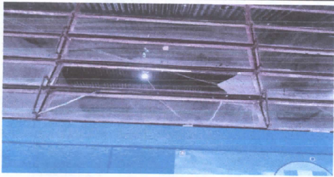
SUSTITUCION DE VENTAS POR BALCONES DE METAL