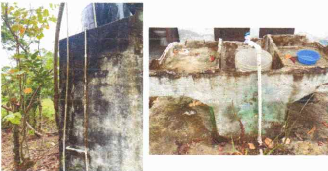
Foto 5: Sustitución de tubería para agua de distribución del pozo y Sustitución de pila.