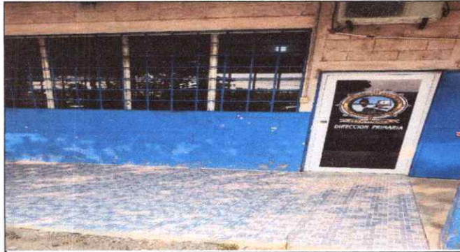
PINTADO DE BALCONES Y PISO ANTIDESLIZANTE