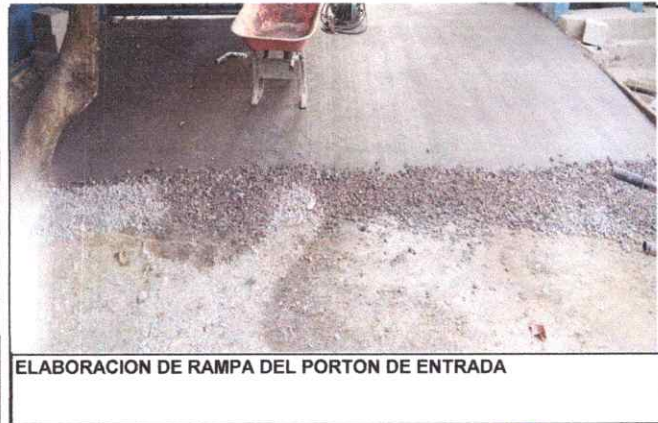
ELABORACION DE RAMPA DEL PORTON DE ENTRADA