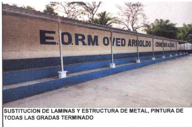
SUSTITUCION DE LAMINAS Y ESTRUCTURA DE METAL, PINTURA DE TODAS LAS GRADAS TERMINADO