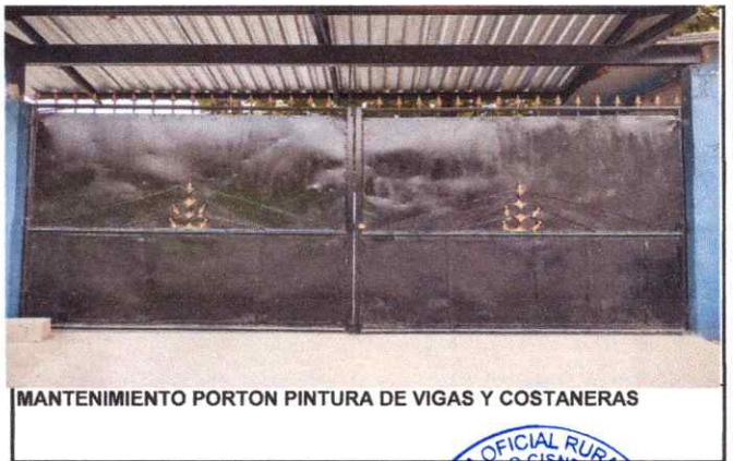
MANTENIMIENTO PORTON PINTURA DE VIGAS Y COSTANERAS

Observación: Si es necesario se pueden agregar hojas adicionales y actualizar el número de hojas.