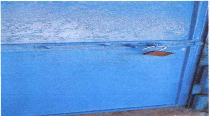
MANTENIMIENTO DE PUERTAS