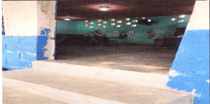
PISO DE TORTA TERMINADO