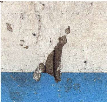
Foto 9: Hierro expuesto en el muro, se realizará mejora en el muro para evitar el deterioro.