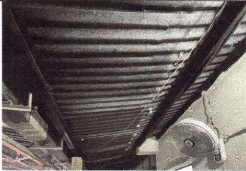
Foto 7: lámina de Aluzinc en mal estado en área que utilizan para realizar actividades, presenta filtraciones