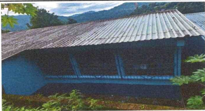
Foto1: Sustitución de balcones de metal