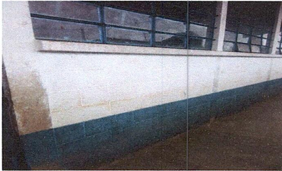
Foto1: Sustitución de pintura inferior e exterior