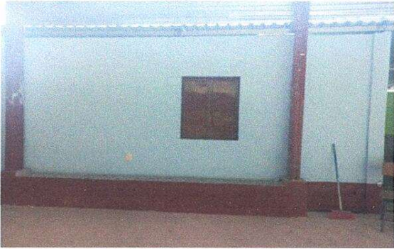
Foto 7. Pared de cocina reparada