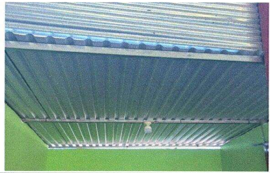
Foto 10. Techo Cambiado

Observación: Si es necesario se pueden agregar hojas adicionales y actualizar el número de hojas.