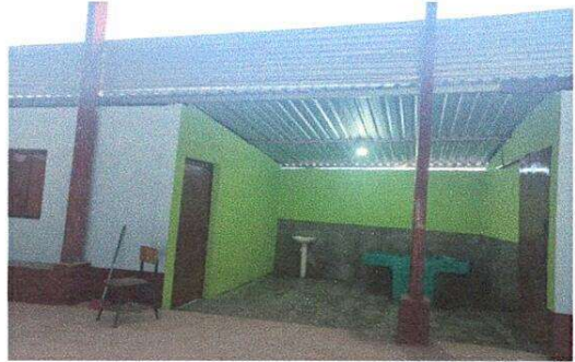
Foto 8. Techo de cocina sustituido en buen estado