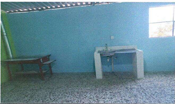
Foto 9. Cocina reparada finalizada