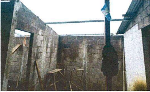
Foto1: Cambiando la pared de la cocina