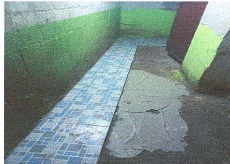
Foto 4: Sustituyendo el piso de cemento por cerámico antideizante