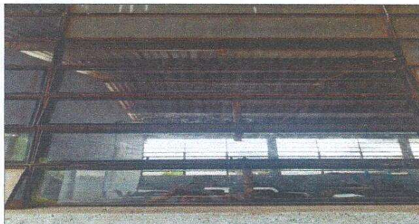
Foto 5: sustitución de vidrios en aulas. Renglón Sustitución de vidrios