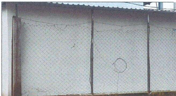
Foto 3: pared exterior de la cocina. Renglón: reparación de cocina