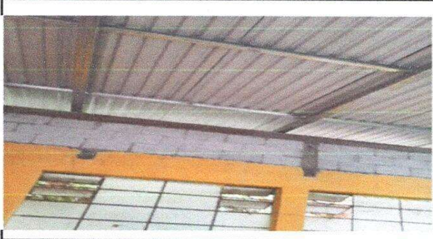
Foto1: trabajo finalizado en la continuidad de paredes.