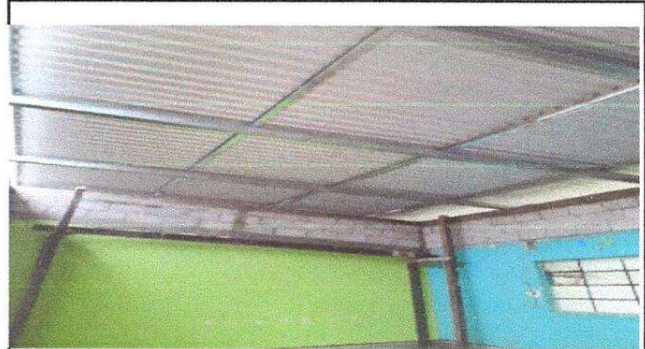
Trabajo finalizado en el cambio de lámina.