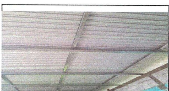
Foto 6: trabajo finalizado en el cambio de estructura de soporte y lámina en las aulas

Observación: Si es necesario se pueden agregar hojas adicionales y actualizar el presente formulario.