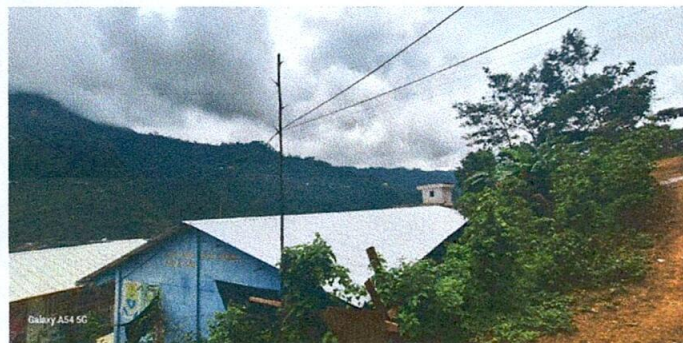
Foto 12: Cuerta de láminas de forma total de las aulas del nivel primario