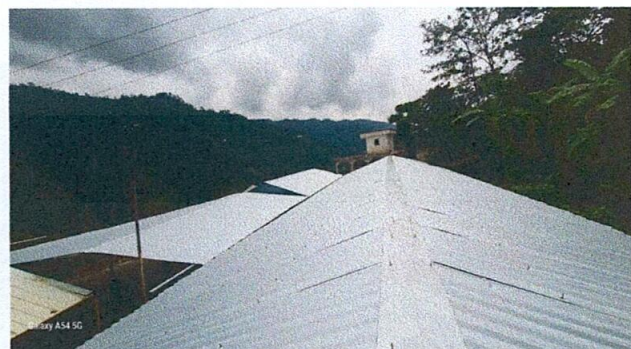
Foto 33. Vista del techo de las aulas del nivel primario