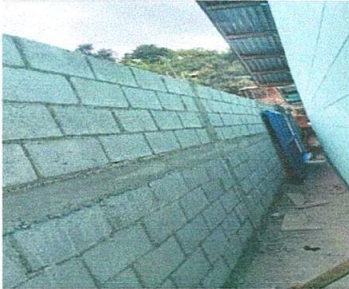
Foto1: Instalación de portón de metal