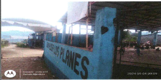
Foto 3: vista frontal del predio de la escuela con circulación incompleta