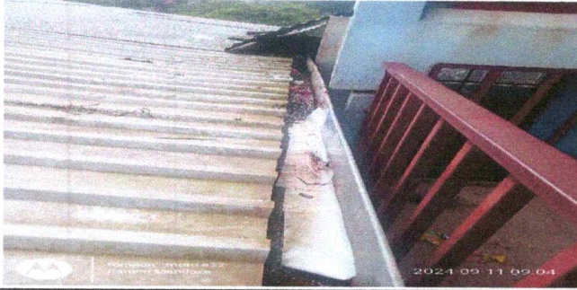
Foto13: Los canales de metal estan en malas condiciones