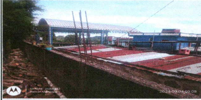
Foto 4: lado norte de la escuela en donde se puede apreciar que esta incompleta la circulación