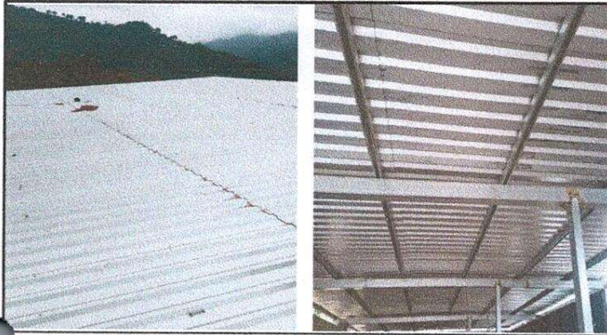
Foto 1: CAMBIO DE TECHO LAMINA POR LAMINA Y COSTANERA POR COSTANERA