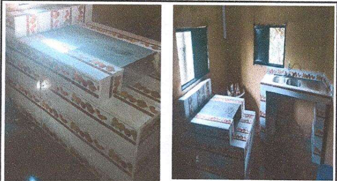
Foto 3: RESTAURACION DE PLANCHA DE COCINA CON SU CERAMICA Y LAVASTRASOS DE METAL