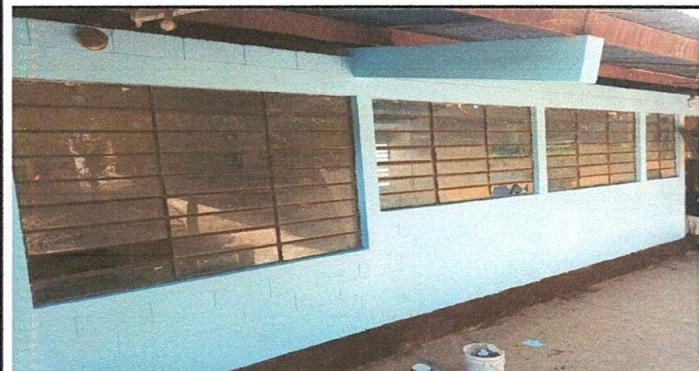
FOTO 5. SUSTITUCIÓN DE PINTURA