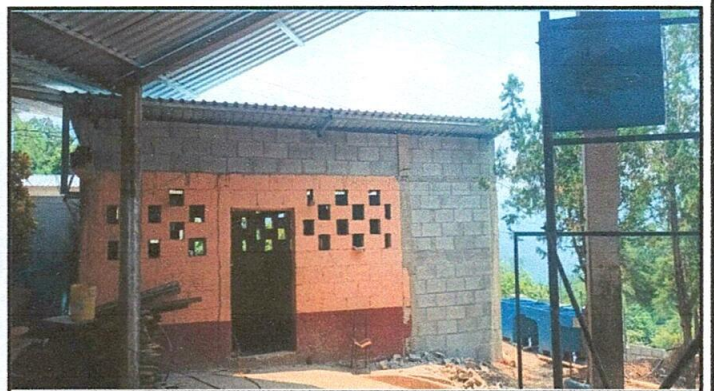
FOTO 4. REPARACION DE COCINA