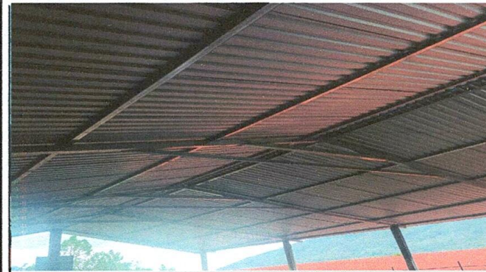
FOTO 3. REPARACION DE TECHO