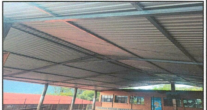
FOTO 2. CAMBIO DE TECHO DE CANCHA/ SALON