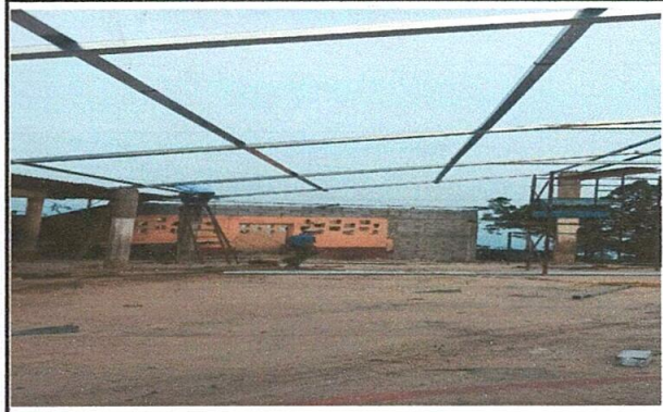
FOTO 2. CAMBIO DE TECHO DE CANCHA/ SALON