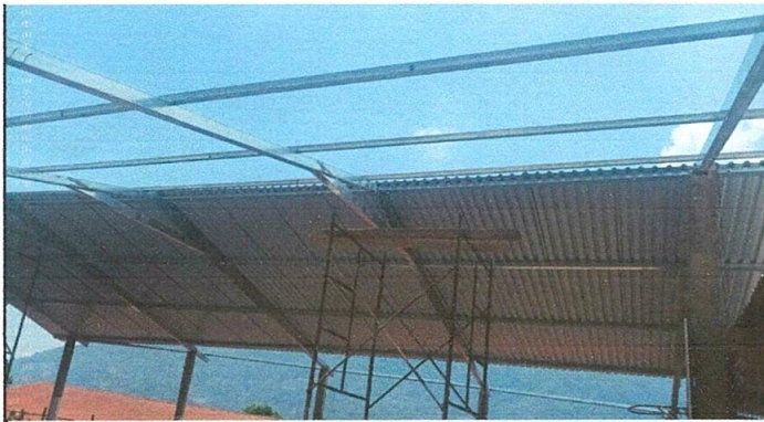
FOTO 3. REPARACION DE TECHO