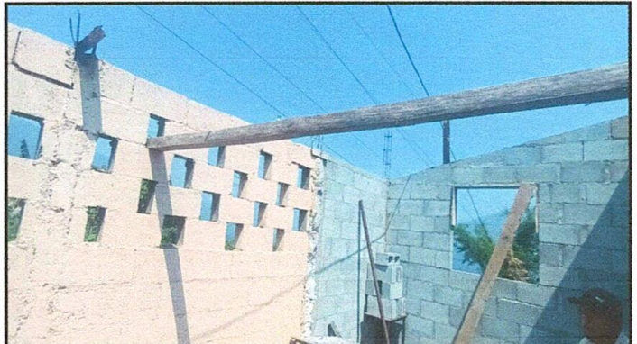
FOTO 4. REPARACION DE COCINA