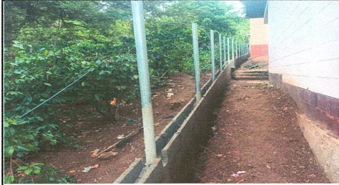
FOTO 1. REPARACIÓN DE CIRCULACION PERIMETRAL