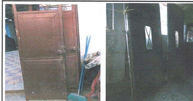
Foto 3: Sustitución de puertas de metal en servicio sanitario y portones