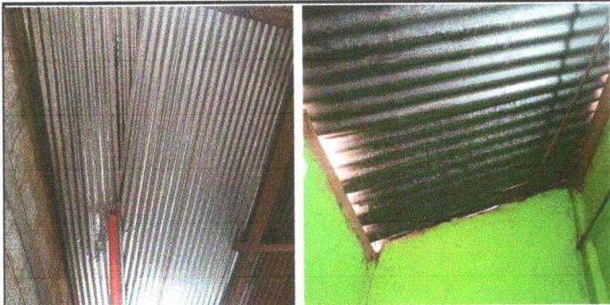
Foto1: Sustitución de lamina por lámina troquelada