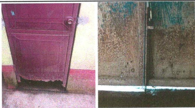
Foto 3: Sustitución de puertas de metal en servicio sanitario y portones