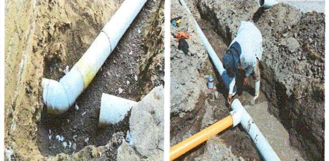
Foto 8: Sustitución de tubería pvc en línea principal de agua fluviales.