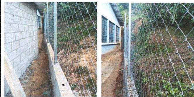
Foto1: Reparación de muro perimetral de block, tubo hg, malla galvanizada, soleras intermedias y columnas.