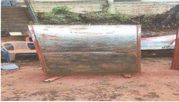
Foto1: Cambio de puertas