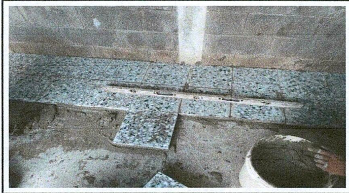
Foto 1: Colocación de piso de granito a la cocina del establecimiento.