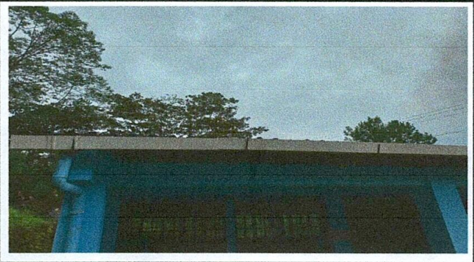
Foto 2: Colocación de canal en la parte frontal del establecimiento y parte de estructura de metal en ventanas.