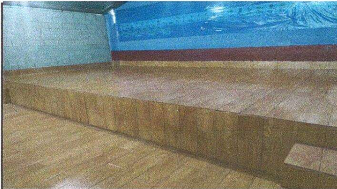
Foto 3: Foto 2: Sustitución de piso de torta de concreto duela de ceramico modulo salon de clases y usos multiples.