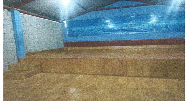
Foto 2: Sustitución de piso de torta de concreto, por piso de ceramico modulo escenario