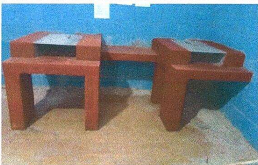
Foto 5: Mejoramiento de fogón pequeño por estufa de leña mejorada