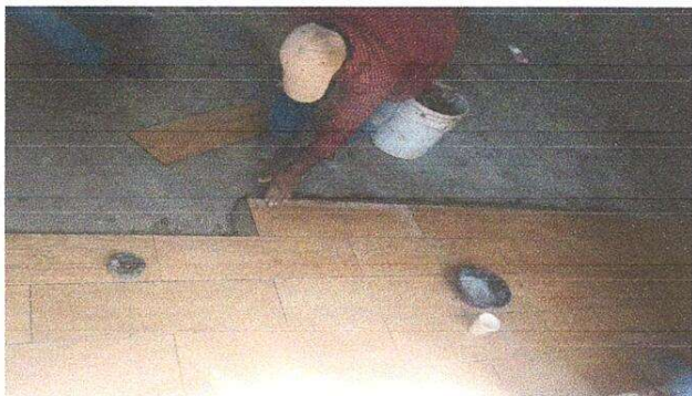
Foto 3: Foto 2: Sustitución de piso de torta de concreto duela de ceramico modulo salon de clases y usos multiples.