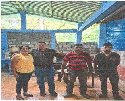
Foto1: Sustitución de malla por pared de block en modulo cocina supervisión del cd y asesor.