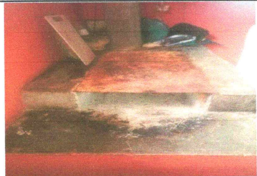
Foto 6: Mejoramiento de fogón pequeño por estufa de leña mejorada.

Observación: Si es necesario se pueden agregar hojas adicionales y actualizar el número de