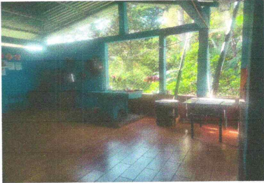
Foto1: Sustitución de malla por pared de block en modulo cocina