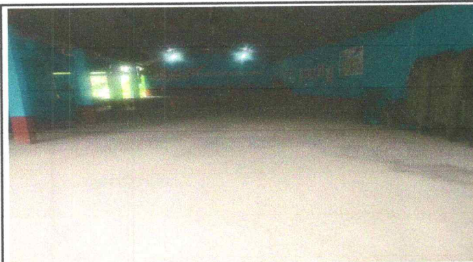
Foto 3: Foto 2: Sustitución de piso de torta de concreto, por piso de ceramico modulo salon de clases y usos multiples.