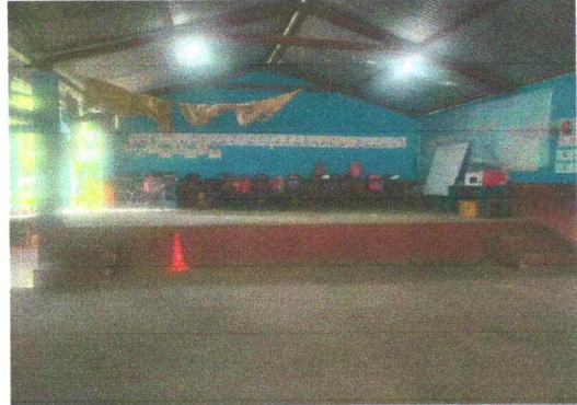
Foto 2: Sustitución de piso de torta de concreto, por piso de ceramico modulo escenario