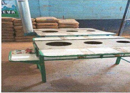
Foto1: Sustitución de planchas y pila plástica