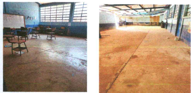
Foto 6: Cambio de piso a tres aulas y el salon o patio de la escuela

Observación: Si es necesario se pueden agregar hojas adicionales y actualizar el número de hojas.