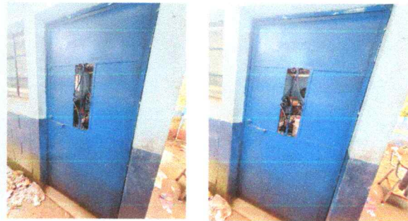
Cambio de puertas de metal