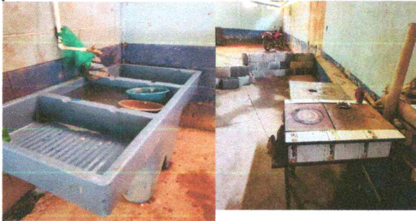
Foto1: Sustitucion de planchas y pila plástica