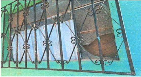
Foto1: Sustitución de balcones de metal