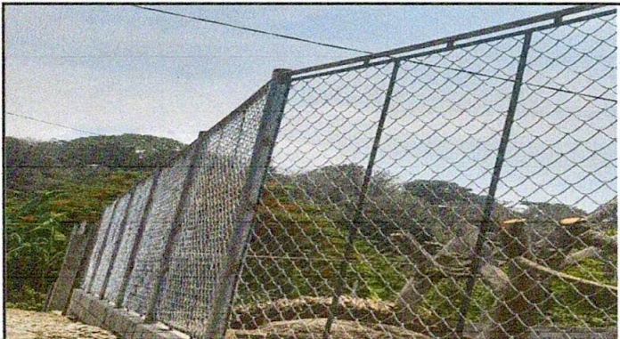
Foto 3: Reparación de muro perimetral de block de 5 hiladas con tubo hg y malla galvanizada (Circulación lateral derecha del establecimiento)