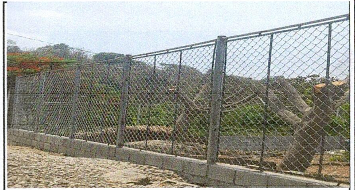
Foto 4: Reparación de muro perimetral de block de 5 hiladas con tubo hg y malla galvanizada (Parte trasera del establecimiento)