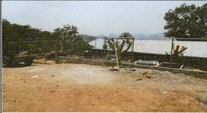
Foto 1: Reparación de muro perimetral de block de 5 hiladas con tubo hg y malla galvanizada (Entrada al establecimiento)