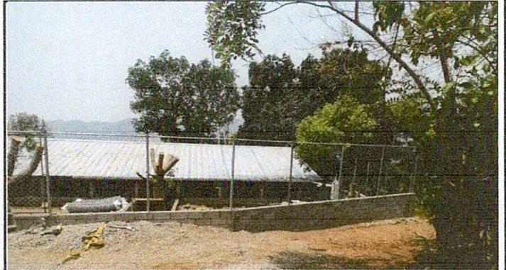
Foto 2: Reparación de muro perimetral de block de 5 hiladas con tubo hg y malla galvanizada (Circulación lateral izquierda del establecimiento)