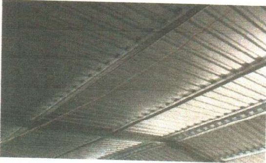
foto 1: Sustitucion de lamina, Sustitucion de capote para lamina, Sustitucion de elementos de fijacion, Sustitucion de estructura de metal