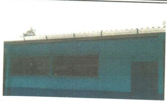
foto 2: Sustitucion de canales y de soporte o pescante y bajadas de agua