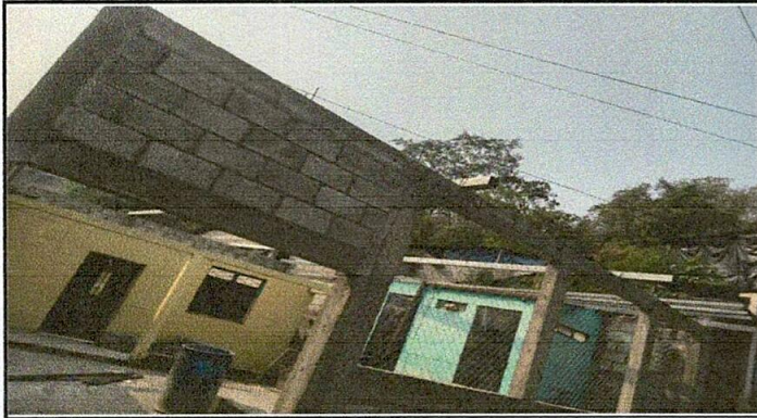
Foto1: Reparación de muro perimetral de block y malla galvanizada, solera y columnas.