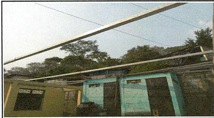
Foto 3: Sustitución de estructura de soporte de metal, por metal.