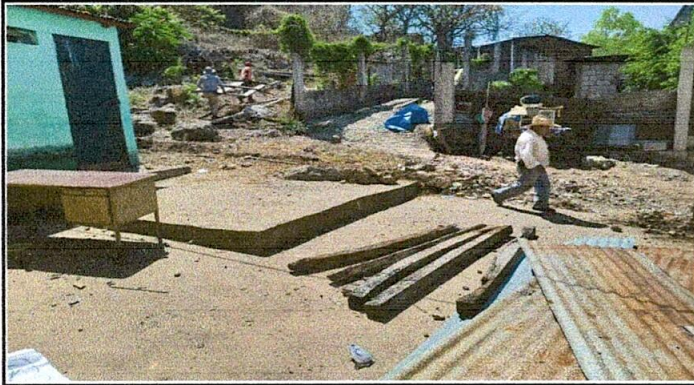
Foto 1: Reparación de muro perimetral de block y malla galvanizada, solera y columnas.