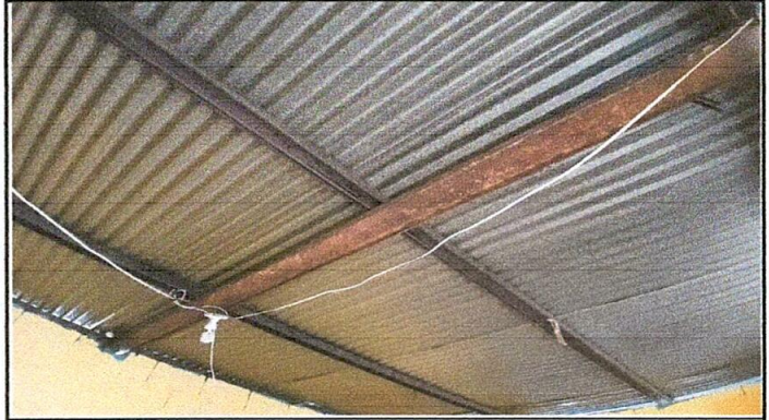
Foto 2: Sustitución de lámina, por lámina troquelada aluzinc calibre 26.