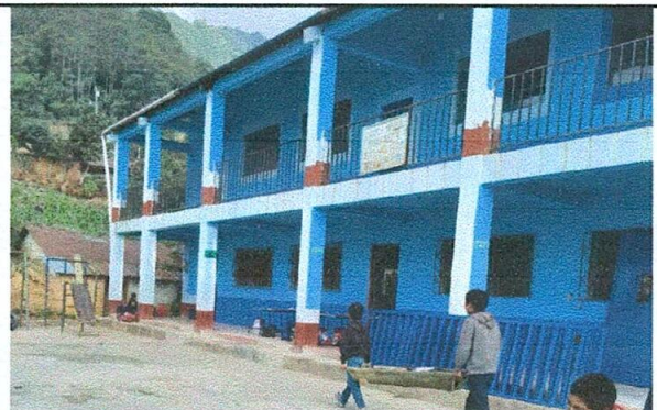
Foto 4: Sustitución de barandas en mal estado por barandas nuevas con tubo cuadrado galvanizado