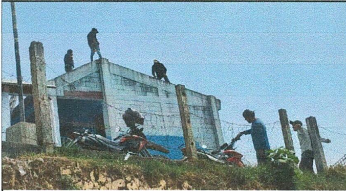
Foto1: Cambio del techo de lámina