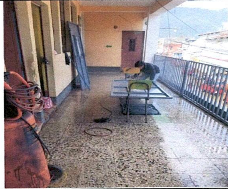
Foto 4: Mantenimiento de estructura de puertas, aplicación de pintura