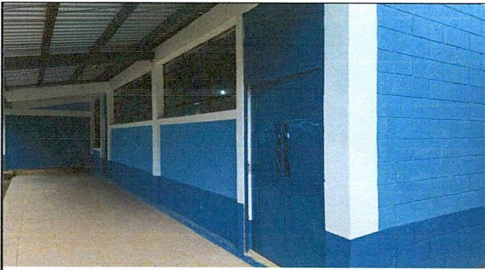
Foto 3: Aplicación de pintura en paredes exteriores e interiores,