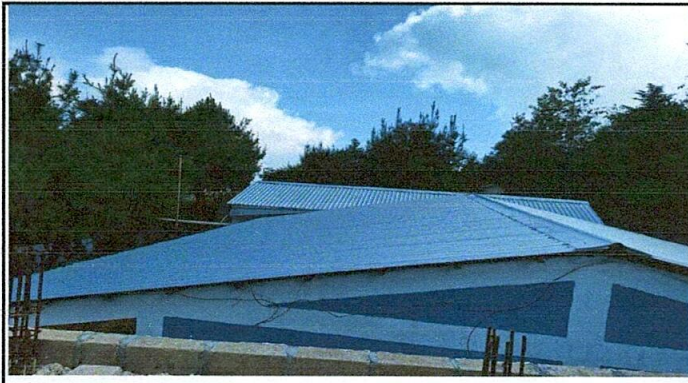
Foto1: Sustitución de láminas troqueladas calibre 24.