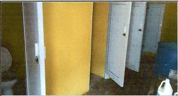
Foto 5: SERVICIOS SANITARIOS Y SUS ACCESORIOS, remodelación de sanitarios para niños