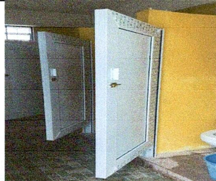
Foto 4: SERVICIOS SANITARIOS Y SUS ACCESORIOS, remodelación de sanitarios para niñas, antes dos sanitarios, ahora cuatro en función