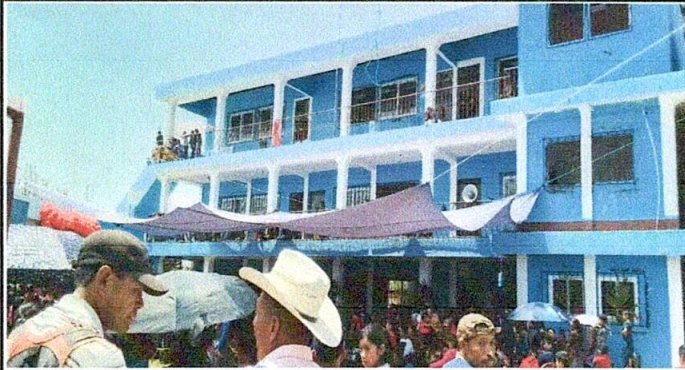
Foto1: 5 VENTANAS, cambio de ventanas de metal a ventanas de PVC