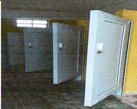
Foto 3: SERVICIOS SANITARIOS Y SUS ACCESORIOS, REMODELACIÓN DE BAÑOS PARA NIÑAS