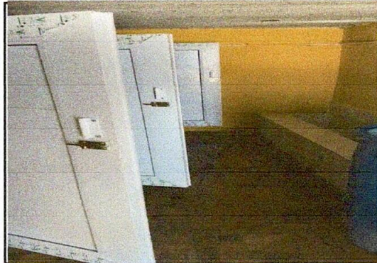
Foto 6: SERVICIOS SANITARIOS Y SUS ACCESORIOS, remodelación de sanitarios para niños

Observación: Si es necesario se pueden agregar hojas adicionales y actualizar el número de hojas.