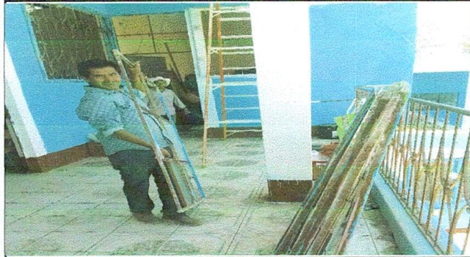
FOTO 1 5 VENTANAS Sustitución de ventanas de metal a ventanas de PVC