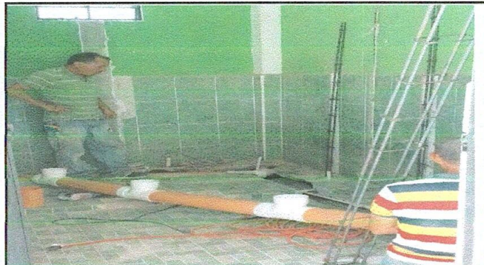
FOTO 3 10 SERVICIOS SANITARIOS Y SUS ACCESORIOS, división de dos a cuatro sanitarios para niñas.