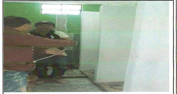
FOTO 4 10 SERVICIOS SANITARIOS Y SUS ACCESORIOS, división de dos a cuatro sanitarios para niñas.