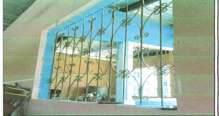
FOTO 2 5 VENTANAS Sustitución de ventanas de metal a ventanas de PVC