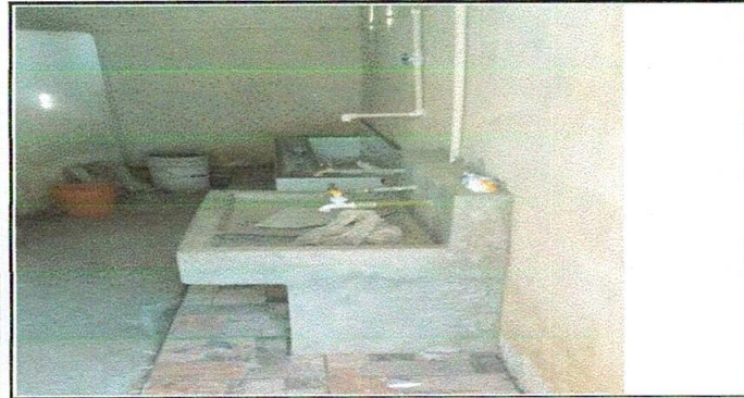
FOTO 5 10 SERVICIOS SANITARIOS Y SUS ACCESORIOS, remodelación de baños de niños