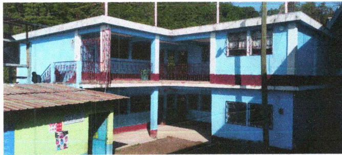
Foto 5: La pintura de las paredes se encuentran deterioradas o despintadas.