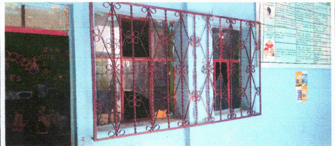
Foto 4: Los balcones necesitan ser pintados para darle una vista diferente a las aulas del centro educativo.