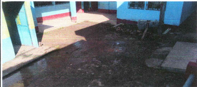
Foto 6: El patio de uno de los módulos se encuentra deteriorado, en época de lluvia provoca acumulación de charcos.

Observación: Si es necesario se pueden agregar hojas adicionales y actualizar el número de hojas.