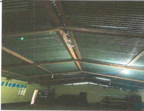
Foto1: Laminas del salon