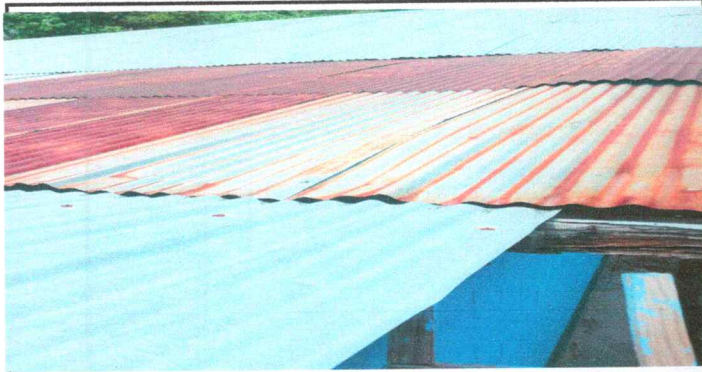
Foto1: Sustitucion de lamina por lamina troquelada