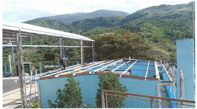
Foto 2. Sustitución de láminas de 1 aula y cocina