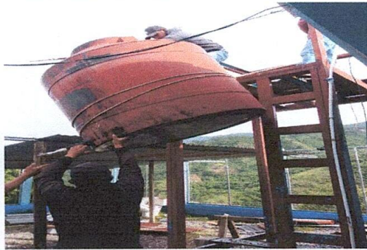
Foto 3. Sustitución de cisterna de agua.