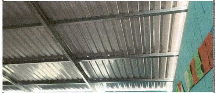
Foto 4: Sustitución de soporte de techo de madera por costaneras galvanizadas