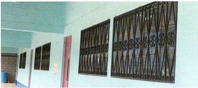
Foto 5: Sustitución de balcones a ventanas de 2 mts de largo por 1 mts de alto