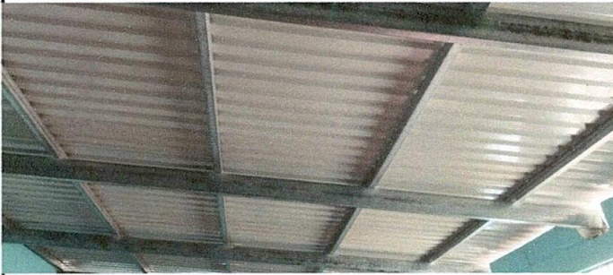
Foto 3: Sustitución de soporte de techo de madera por costaneras galvanizadas