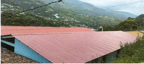
Foto1: Sustitución de lamina duralita por lámina troquelada